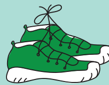
Chaussures liées par paire

TOUS LES TEXTILES PROPRES ET SECS même abîmés.