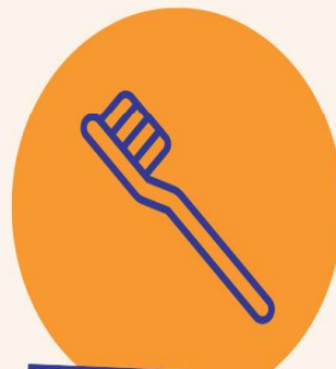
Brosses à dents